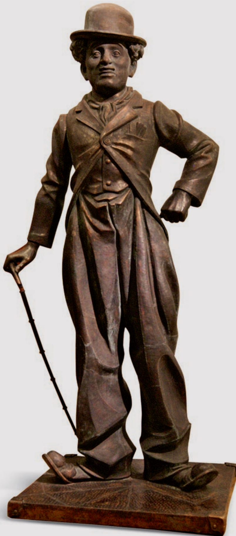
Памятник Чарли Чаплину Высота 3 м. Бронза 2005