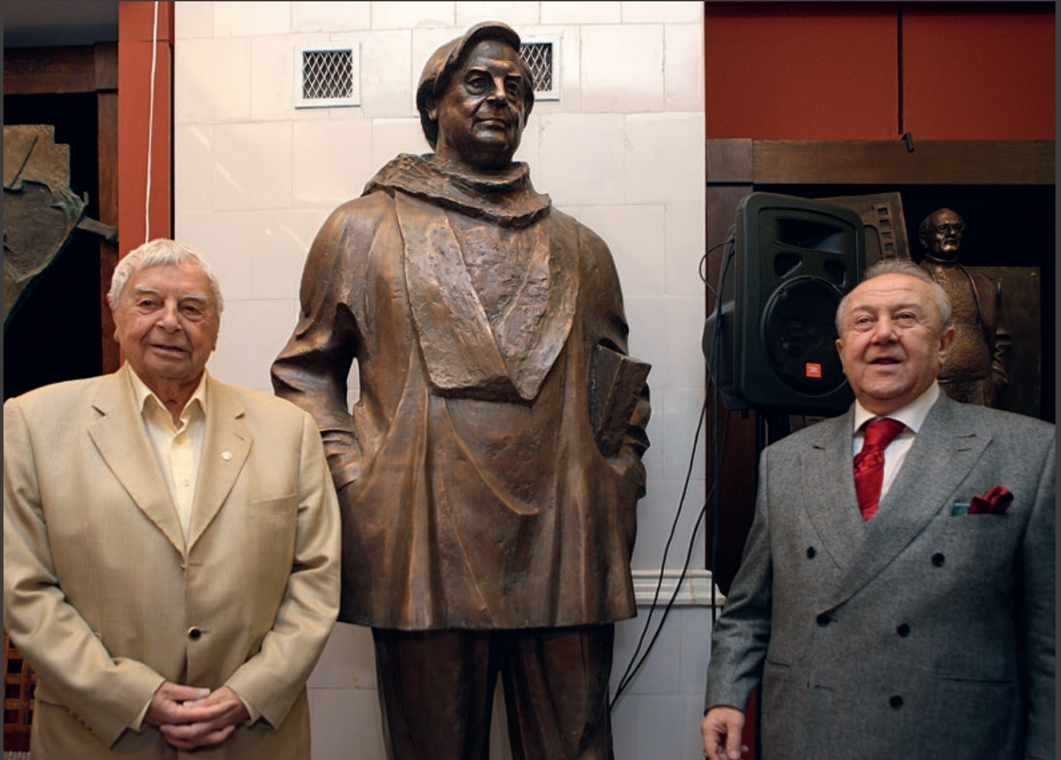
Юрий Любимов и Зураб Церетели