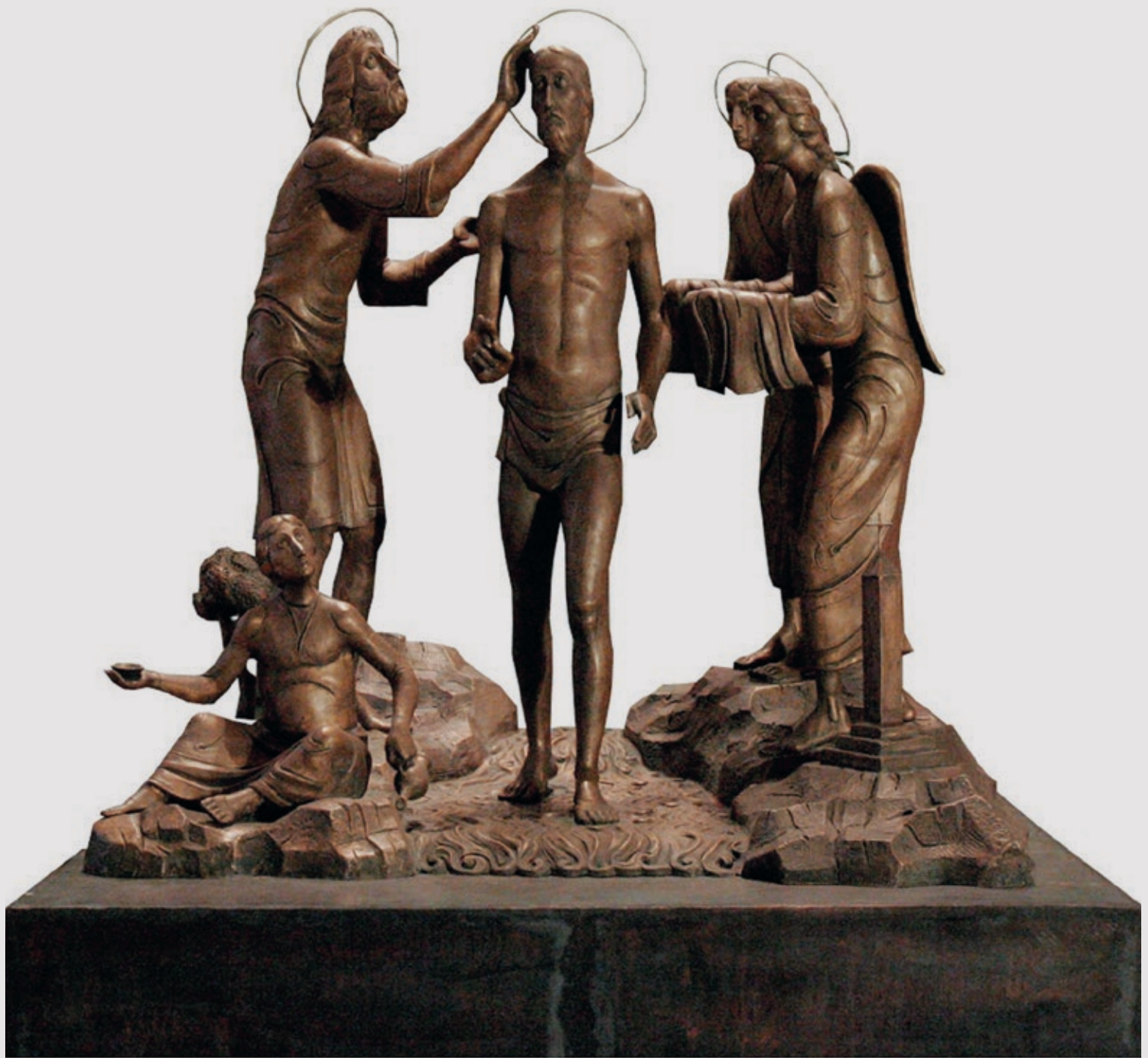
Крещение Господа Иисуса Христа в Иордане Бронза. Высота 1,2 м 2004