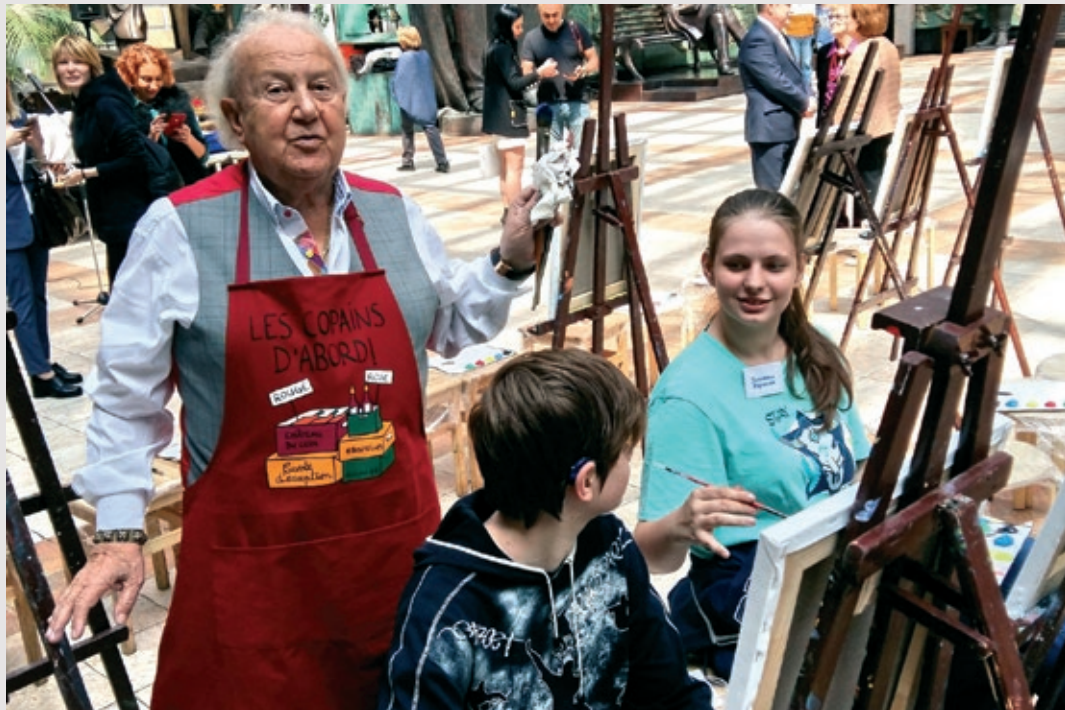
Зураб Церетели в кругу семьи