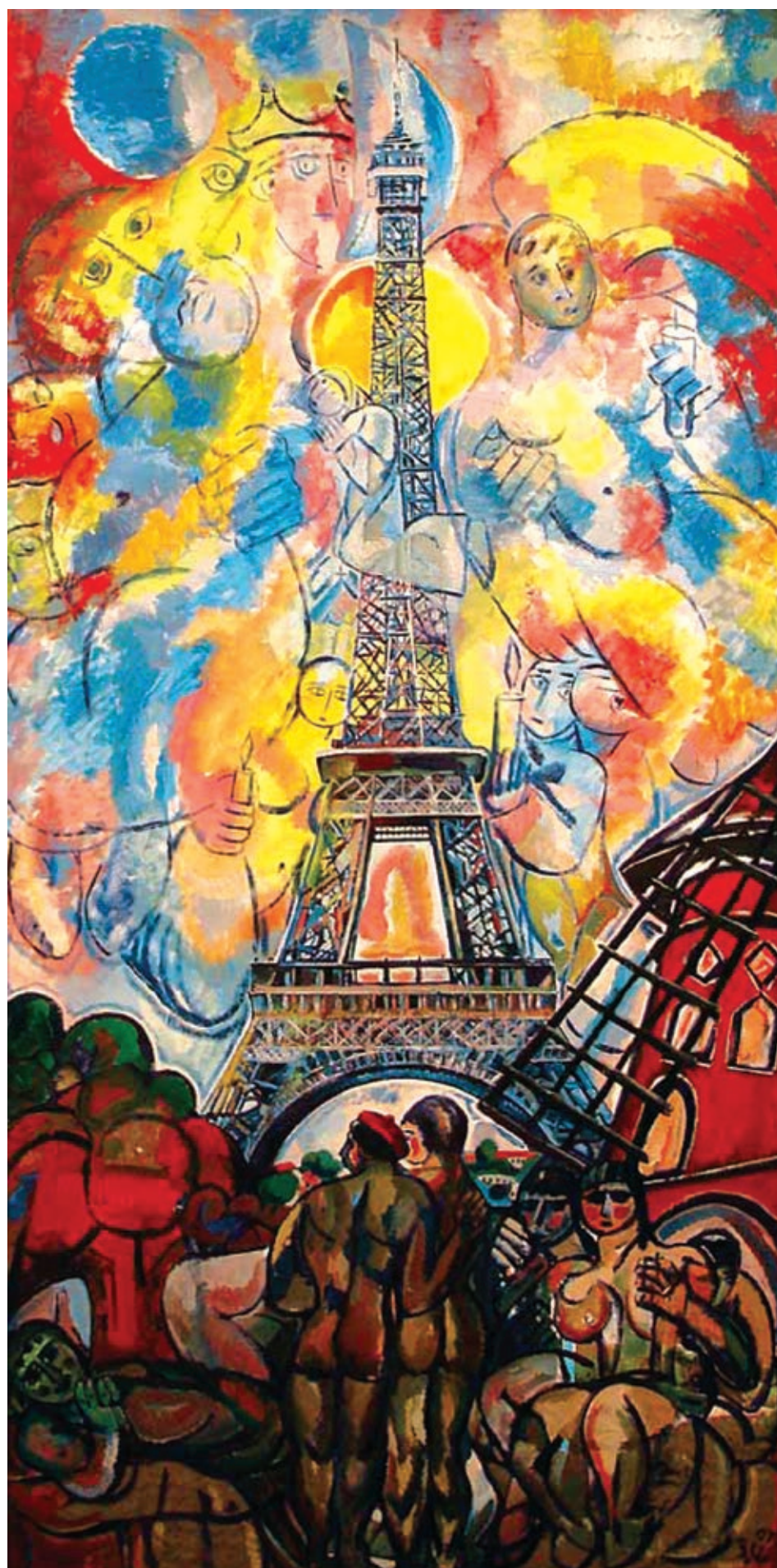
Париж 17 сентября Холст, масло 2007