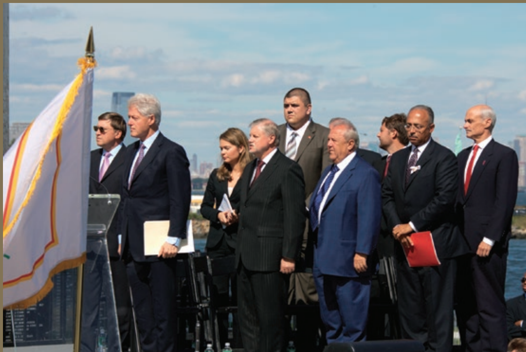
11 сентября 2006 года в городе Байонн штата Нью-Джерси в США состоялось торжественное открытие монумента жертвам международного терроризма «Слеза скорби»